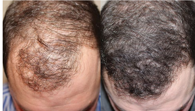
mężczyzna 36 lat, 2600 graftów, 1 zabieg NeoGraft®